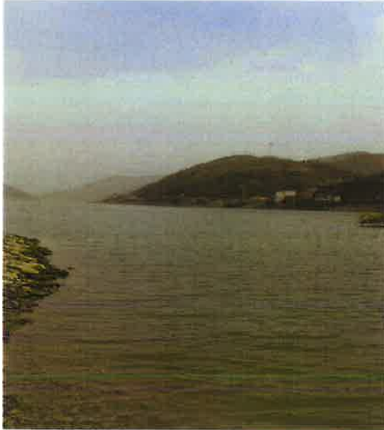
汉江羊尾国控断面