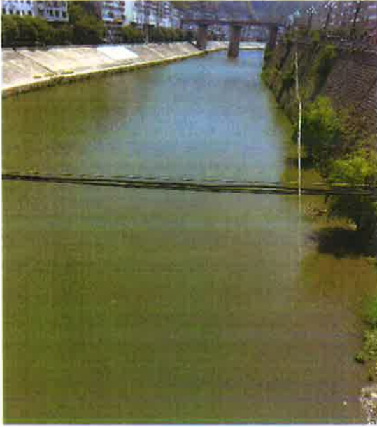
白石河入汉江断面