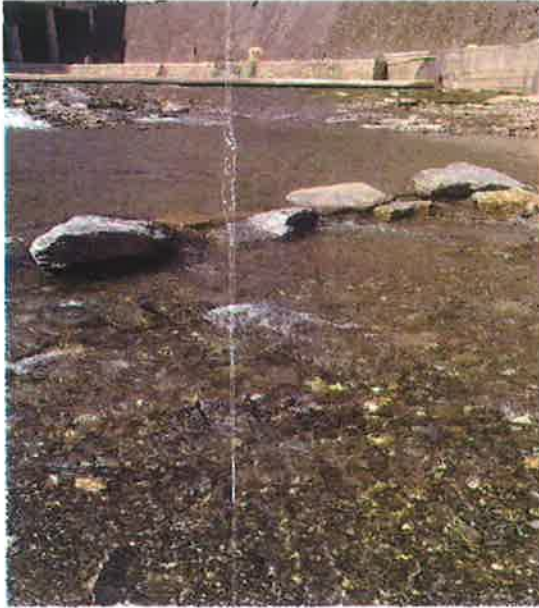
白石河入汉江断面