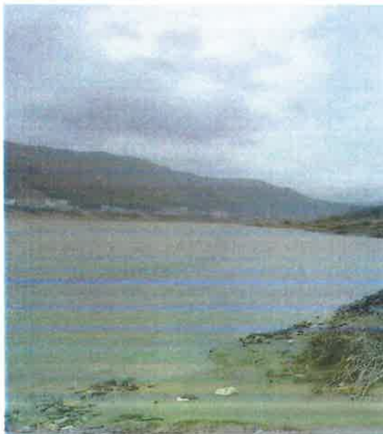
汉江羊尾国控断面