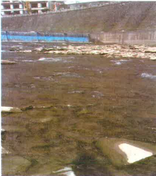
白石河入汉江断面