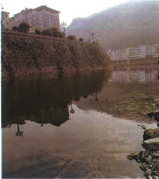
白石河入汉江断面