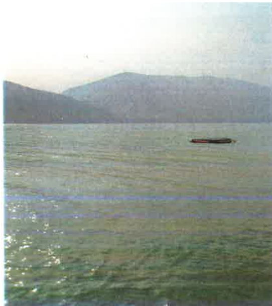
汉江羊尾国控断面