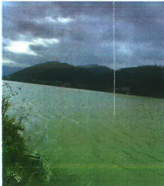
汉江羊尾国控断面