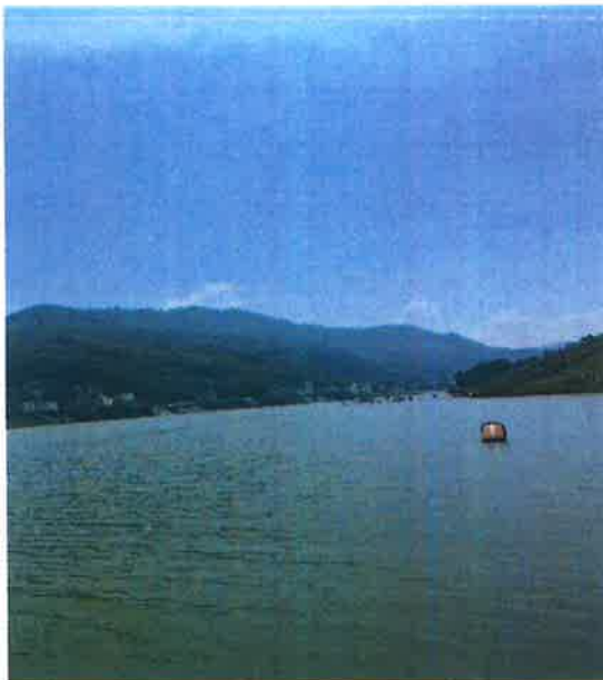
汉江羊尾国控断面