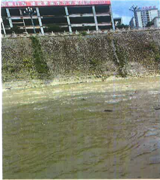
白石河入汉江断面