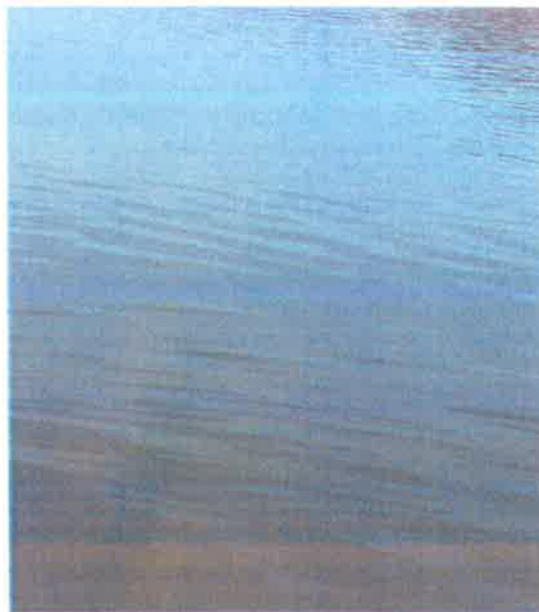
汉江羊尾国控断面